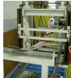
Testé à plus de 300 kg sur la machine de torture !